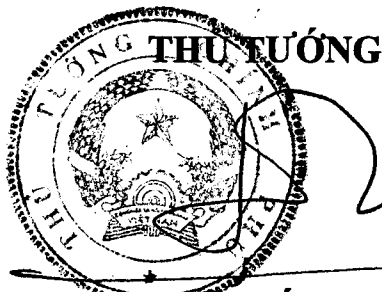
Nguyễn Tấn Dũng

c) Phân bổ kinh phí thực hiện Chương trình: Kinh phí thực hiện Chương trình hỗ trợ pháp lý liên ngành dành cho doanh nghiệp được bố trí trong dự toán ngân sách hàng năm của các Bộ, ngành Trung ương chủ trì hoạt động của Chương trình. Hàng năm, trên cơ sở kế hoạch thực hiện Chương trình do Ban Chỉ đạo Chương trình lập trong phạm vi hoạt động của Chương trình đã được Thủ tướng Chính phủ phê duyệt, cơ quan chủ trì hoạt động của Chương trình lập dự toán chi tiết thực hiện và tổng hợp chung vào dự toán ngân sách của cơ quan mình gửi cơ quan có thẩm quyền theo quy định của Luật Ngân sách Nhà nước và các văn bản hướng dẫn Luật.